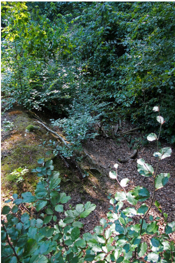
Haan Hohlweg