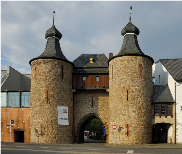
Hexenturm in Jülich (2009)