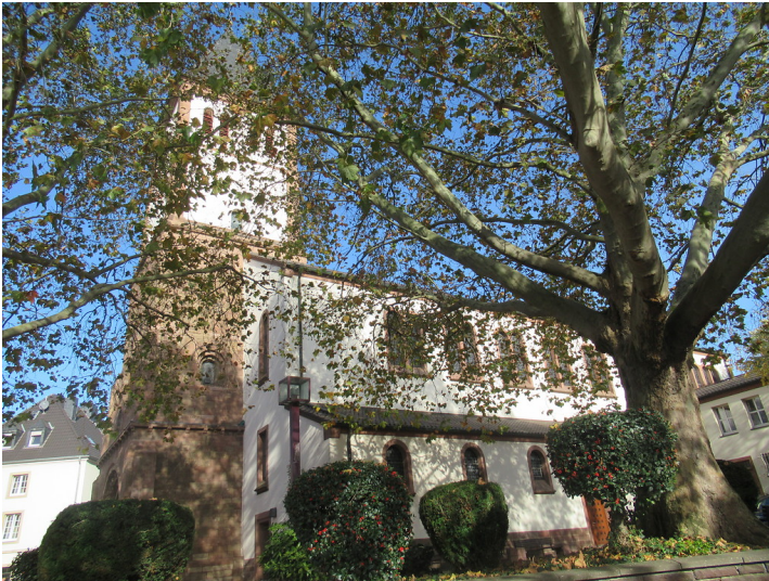
Jülich, Propsteipfarrkirche St. Mariä Himmelfahrt, Kirchplatz