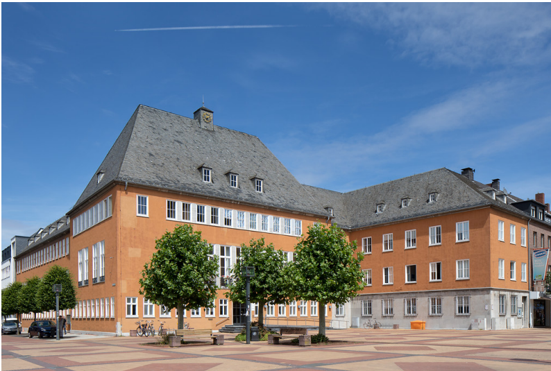
Jülich, Marktplatz 1, Altes Rathaus