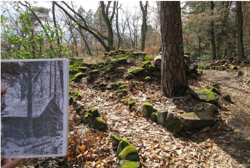
Die Eremitage früher und heute