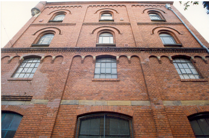
Kwatta Kakao- und Schokoladenfabrik (2019)