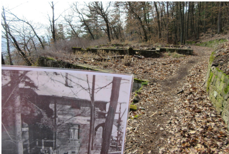
Schweizer Haus: Vergangenheit und Gegenwart