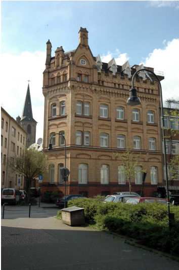
Stollwerk (2018)