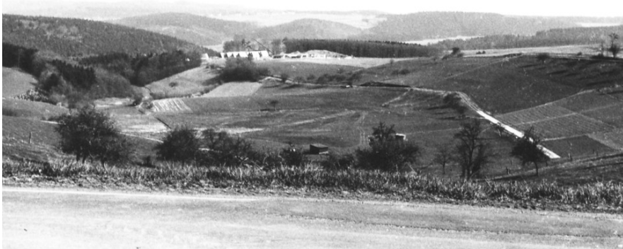
Blick von Sassen ins Heilbachtal (um 1920)