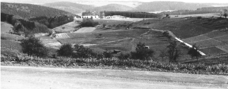
Blick von Sassen ins Heilbachtal (um 1920)