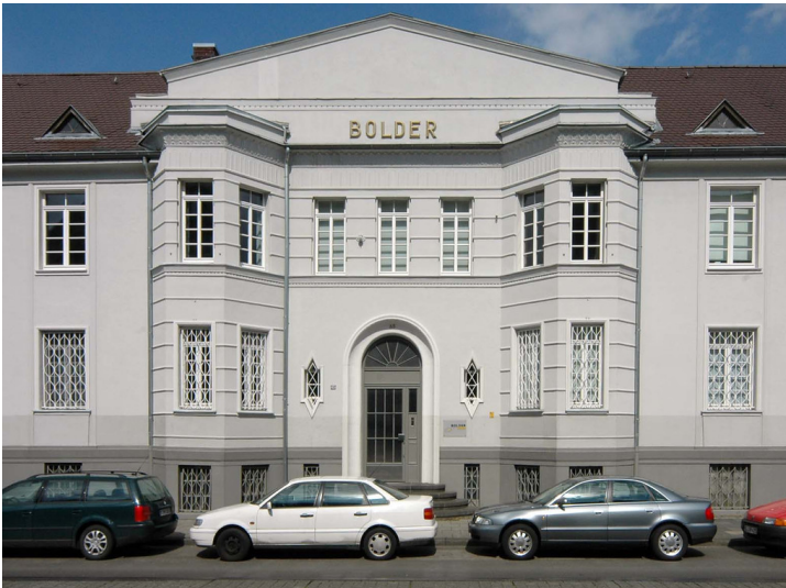
Tabakfabrik Paustian / Fabian (2018)