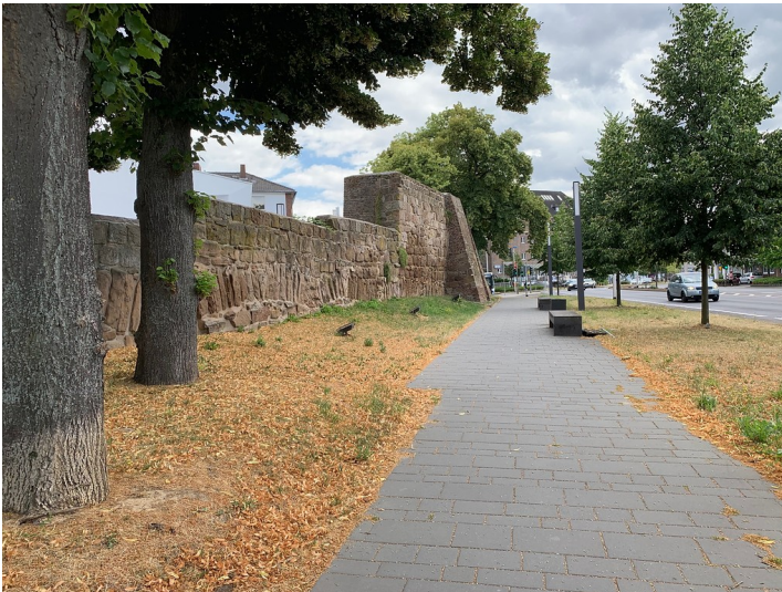
Rest der Dürener Stadtmauer in der Wallstraße (2019).