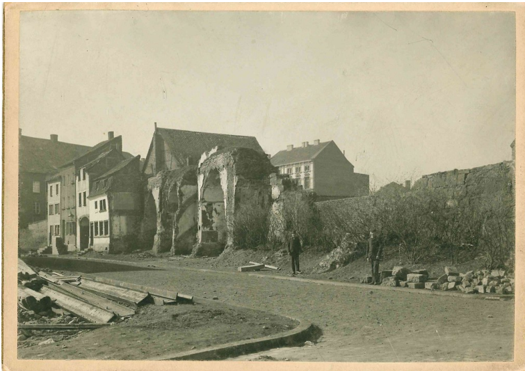
Die frei stehenden Reste der Dürener Stadtmauer in der Wallstraße auf einer historischen Aufnahme (vermutlich Anfang des 20. Jahrhunderts), dahinter Wohnhäuser.