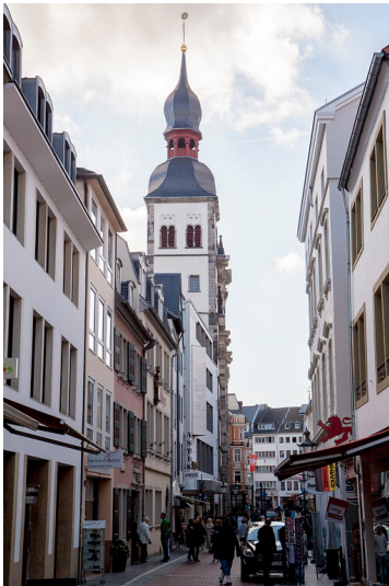
Namen-Jesu-Kirche in Bonn (2015)