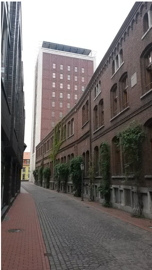
Der zum Stammhaus des Magenbitter-Herstellers Underberg gehörende "Kräuterturm" in Rheinberg (2016).