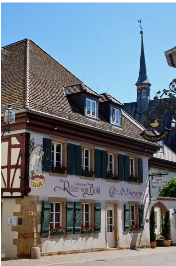
Stiftung Bürgerhospital in Deidesheim, mit dem Gästehaus Ritter von Böhl und dem Café Alt Deidesheim (2019)