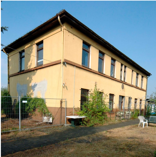
Das Bahngelände "Betriebsleitung 05" auf dem Verschiebebahnhof Nippes in Köln, dessen Fläche sich über die beiden Stadtteile Longerich und Bilderstöckchen erstreckt (2006).