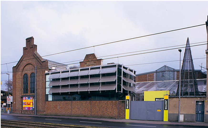
Maschinenfabrik Voss (2018)