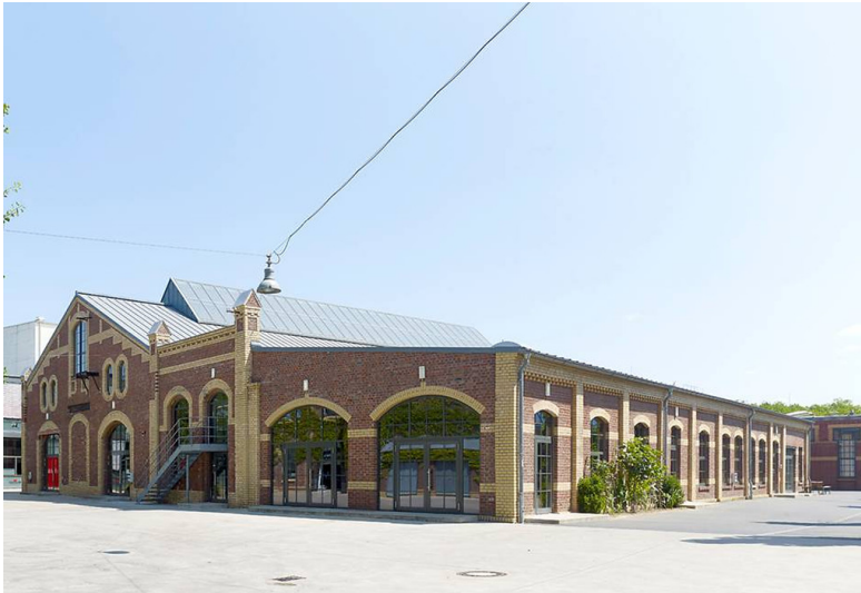
Vulkan_Leuchtenhalle (2018)