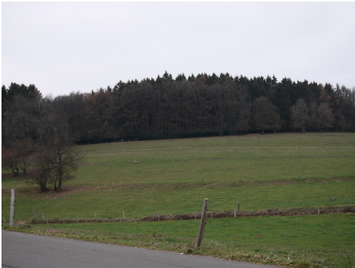
Steinbruch Niederwette. (2018)