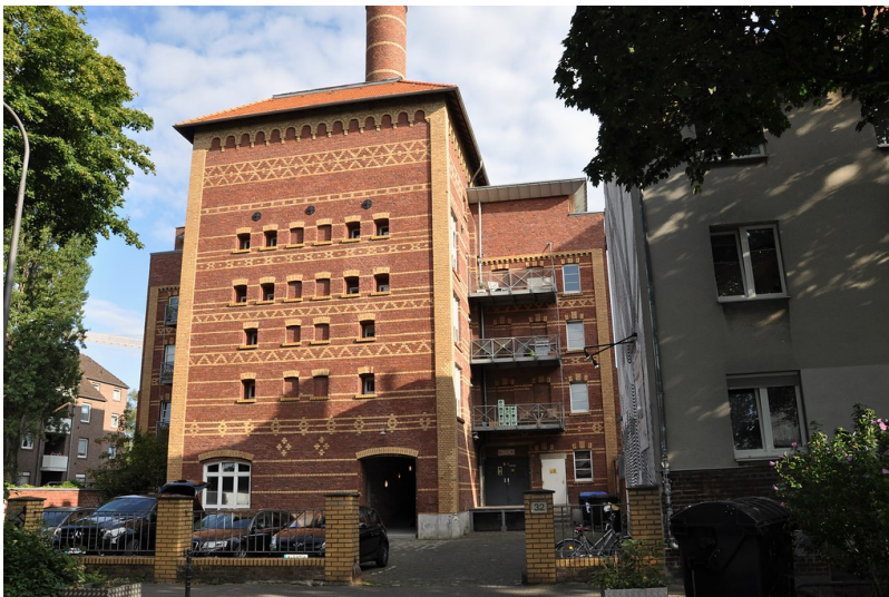
Mälzerei Hospeltstraße (2019), Frontansicht.