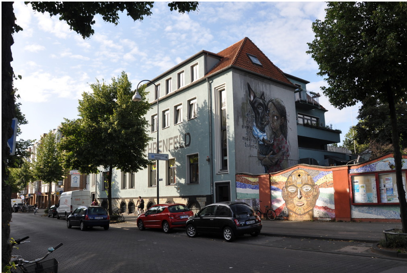
Verwaltungsgebäude der Bleifarbenfabrik Leyendecker in Köln-Ehrenfeld (2019), Nordansicht mit Teil der ehemaligen Werksmauer.