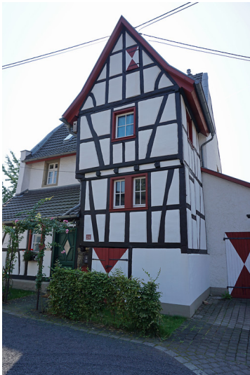
Hofanlage Alte Burg in Bruchhausen (2019)