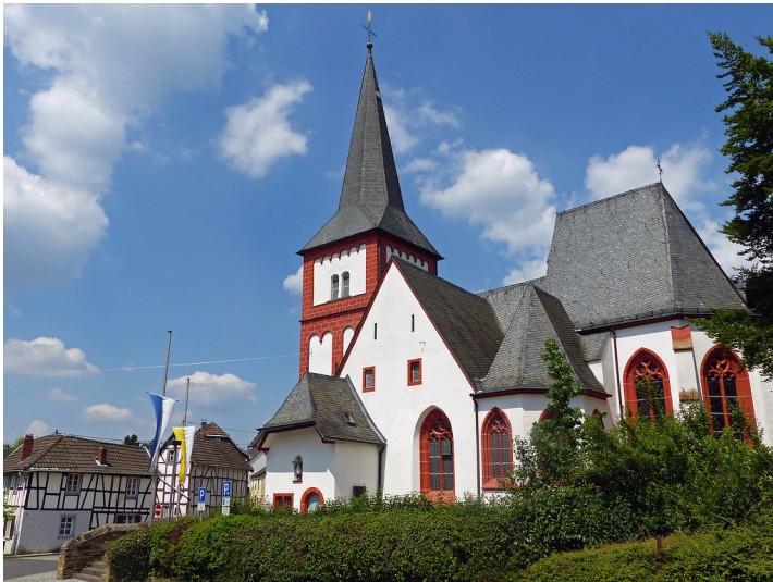
Pfarrkirche St. Johann Baptist in Bruchhausen (2017)