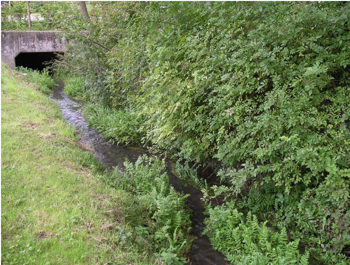
Die Strunde im Bereich unmittelbar nach der Quelle (2004).