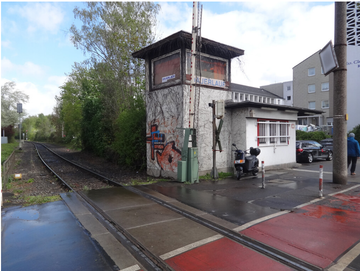
Güterbahnhof Braunsfeld (2018)