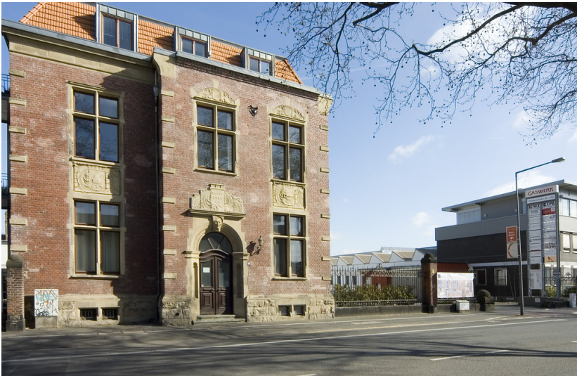
Gaswerk der Stadt Köln in Ehrenfeld (2018)