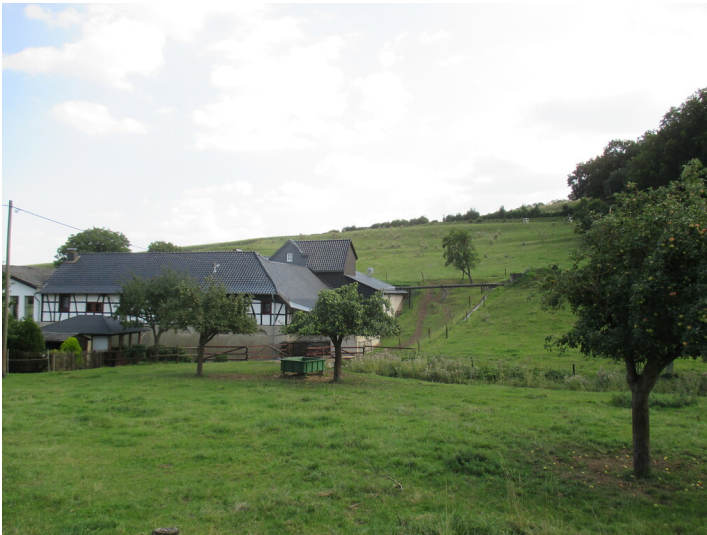
Mühlengebäude aus Fachwerk am Neffelbach bei Embken, umgeben von alten Streuobstwiesen (2015)