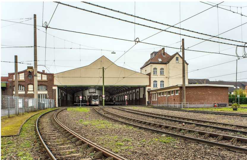
Straßenbahndepot Thielenbruch (2018)