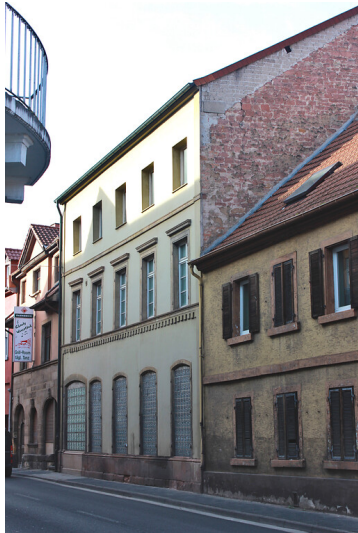
Außenansicht ehemaliges Triftamt Neustadt