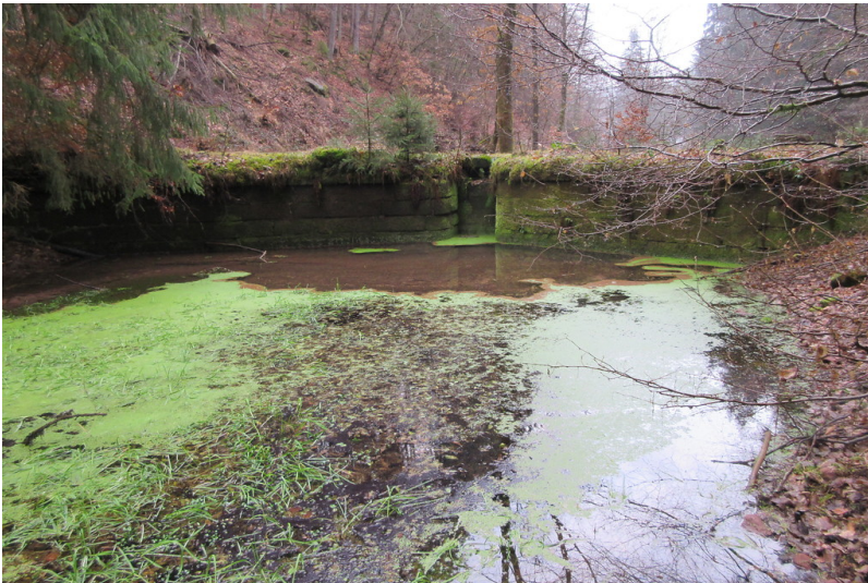
Dammbereich des teilweise gefüllten Schelmenwoogs