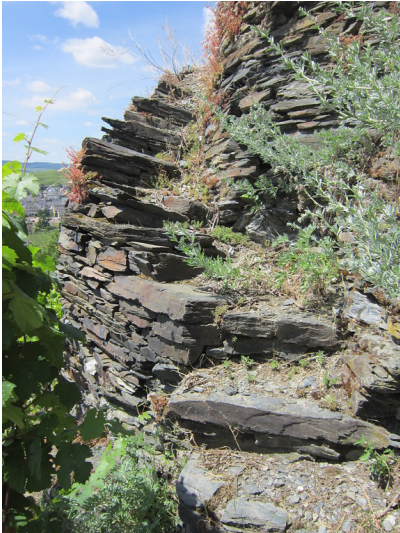
Weinbergmauer mit Treppe am Trittenheimer Fährfels (2014)