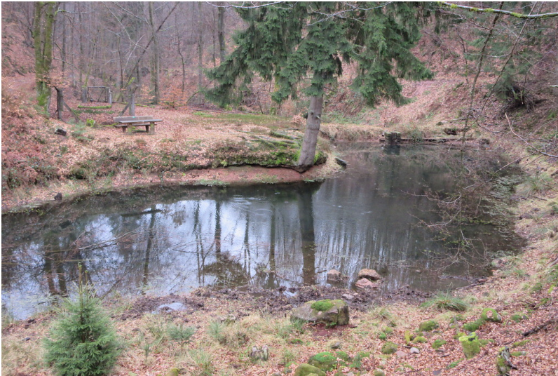
Aaronswoog in idyllischer Umgebung am Wellbach