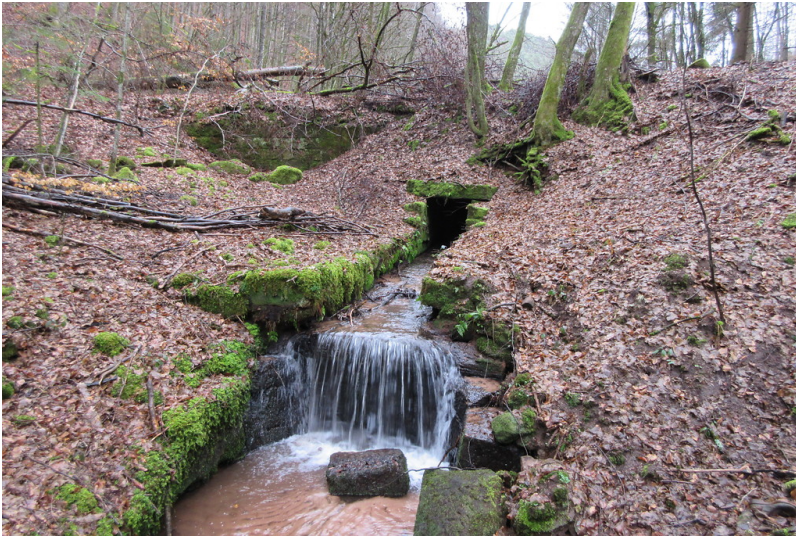
Grundablass am Hansenwoog am Scheidbach