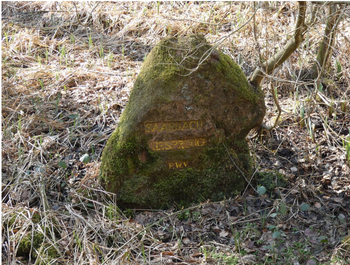
Ritterstein Nr. 198 "Saarbach Ursprung" nordwestlich von Ludwigswinkel an der L 478 (2022)