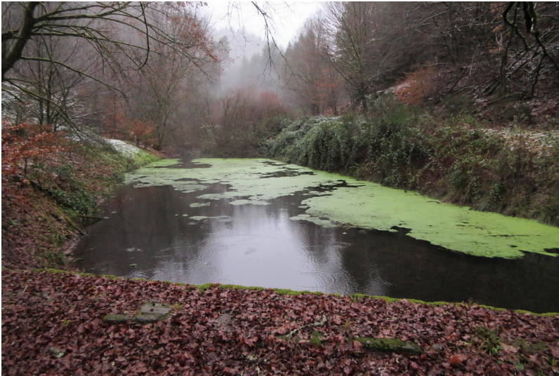
Blick vom Damm auf den Kunzenthaler Woog am Modenbach