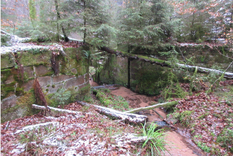
Dammbereich des abgelassenen Grünthaler Wooges