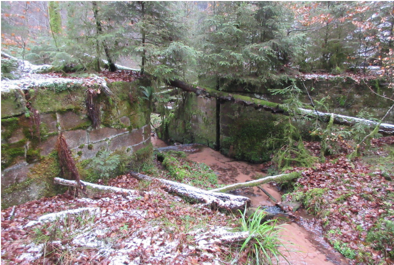
Dammbereich des abgelassenen Grünthaler Wooges