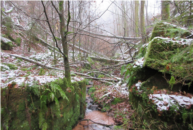
Dammereich und baumbewachsenes leeres Woogbecken