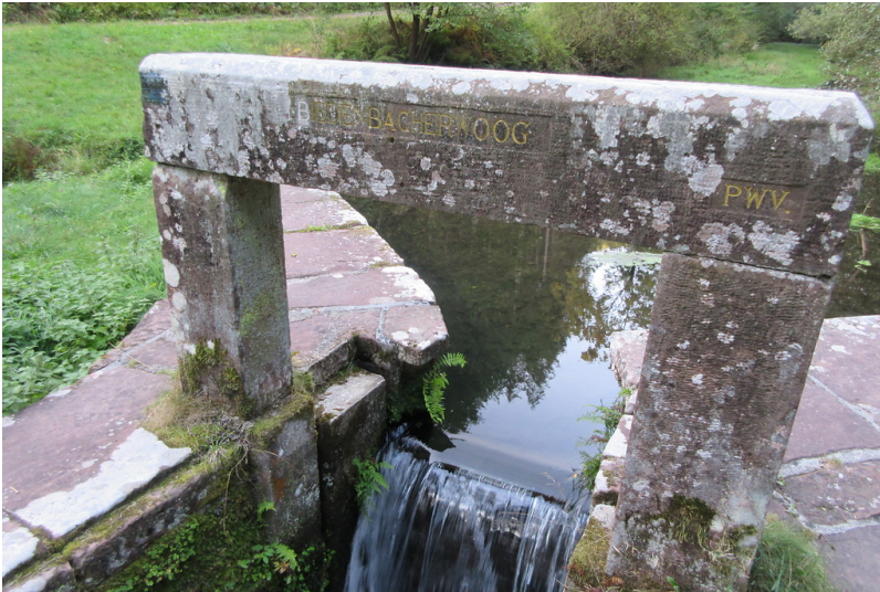
Ritterstein Nr. 156 "Biedenbacherwoog"