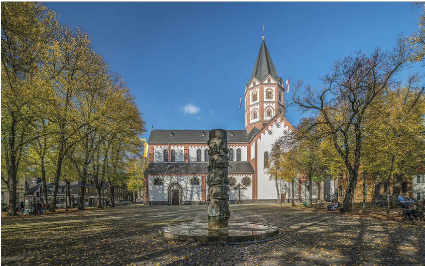
Gerricusplatz in Düsseldorf-Gerresheim