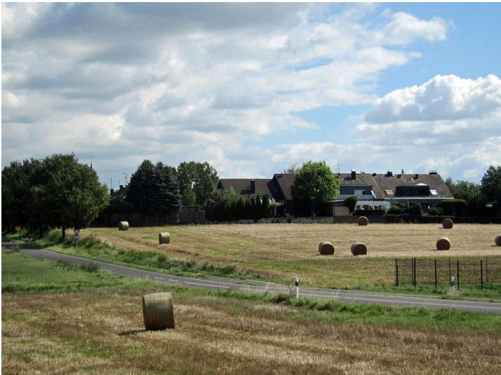
Blick auf das zu Jüchen gehörende Dorf Bedburdyck, durch das der Jüchener Bach fließt (2014).