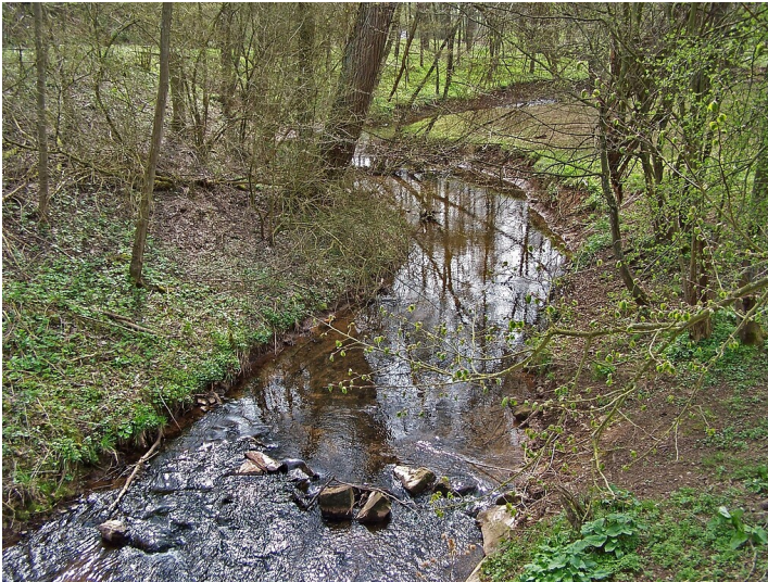
Der Eschweiler Bach bei Bad Münstereifel (2006).