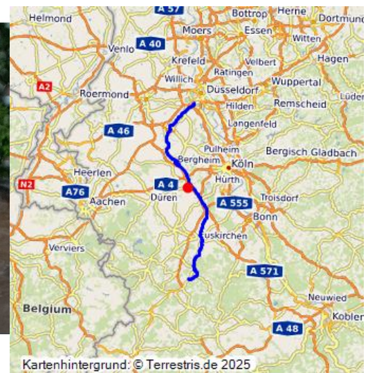
Digitale Ausstellung zur Flut 2021 "So was haben wir noch nicht erlebt!"

Die Erft ist ein linker Nebenfluss des Rheins. Ihre Quelle entspringt unterhalb des Himbergs bei Nettersheim-Holzmülheim.