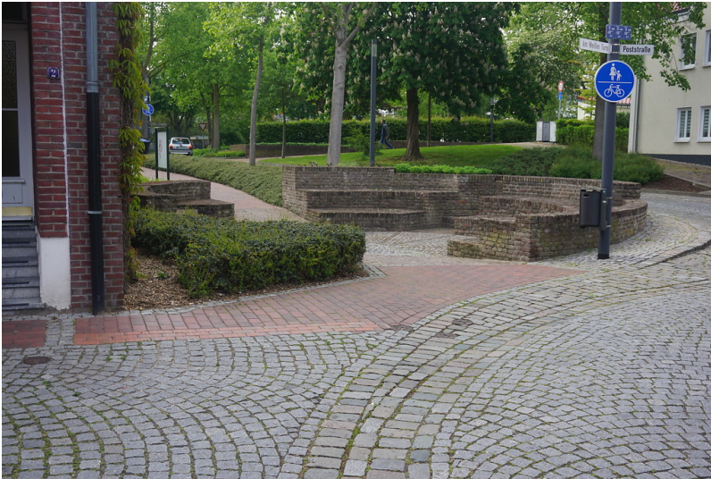
Rees, Rhinwicker Tor, Blick aus der Innenstadt (2019)