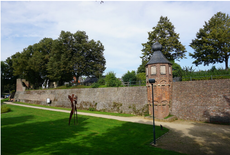
Rees. Partie der Festungsanlage im Südwesten der Stadt mit Wächterturn (vorn) und Weißem Turm (hinten) (2021)