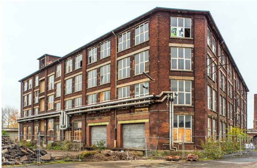
Waggonfabrik van der Zypen & Charlier (2018)