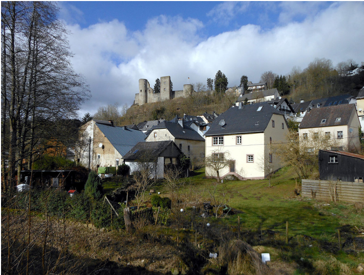
Blick über den Ort Schönecken mit der Burgruine im Hintergrund (2014)