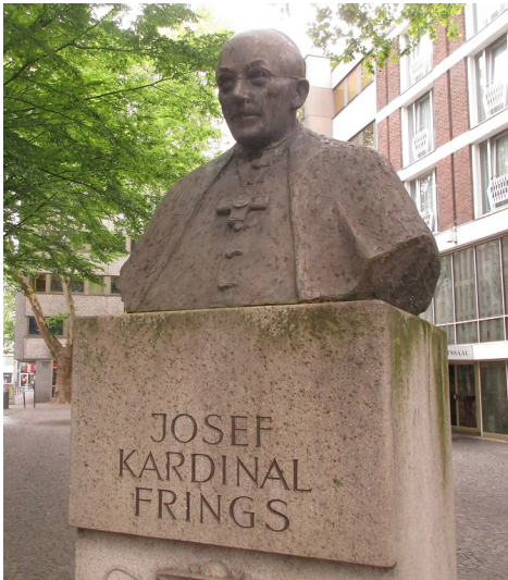
Das bronzene Denkmal für Josef Kardinal Frings am Kölner Laurenzplatz in Altstadt-Nord (2019).