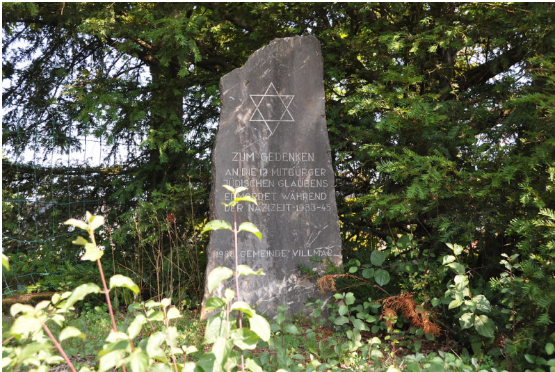
Gedenkstein für die ermordeten Juden auf dem Jüdischen Friedhof Villmar (2019)