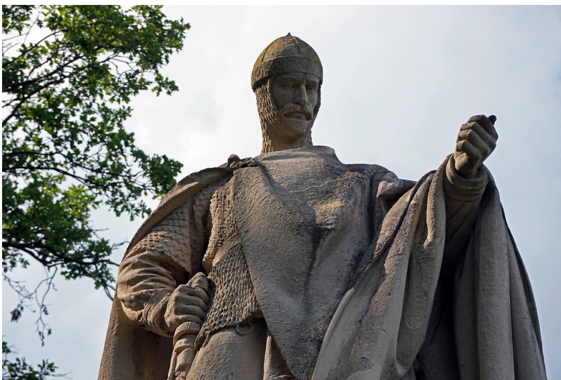
Villmarer Lahn-Marmor-Weg; Rundweg 2, Denkmal für Konrad I. (2019)